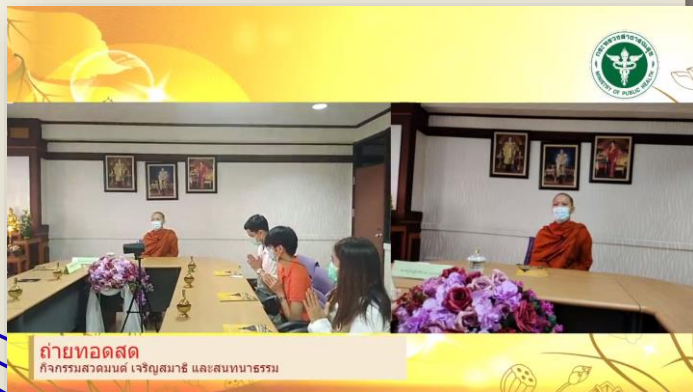
ถ่ายทอดสด กิจกรรมสวดมนต์ เจริญสมาธิ และสันทนาการ