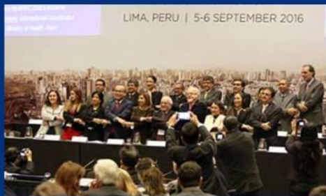
PERU – 22 PARTIES