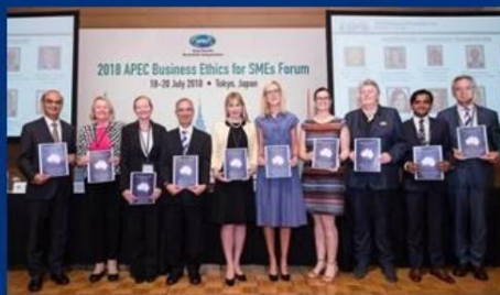
AUSTRALIA – 70+ PARTIES