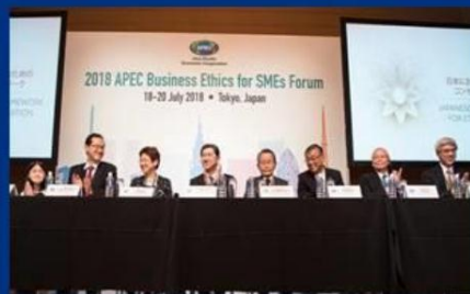
JAPAN – 8 PARTIES