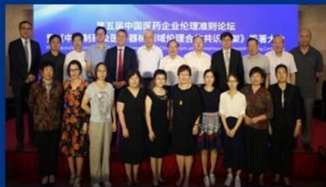
CHINA – 25 PARTIES