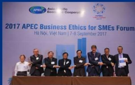
VIET NAM – 9 PARTIES