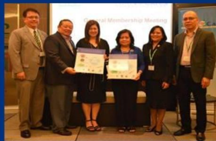
PHILIPPINES – 17 PARTIES