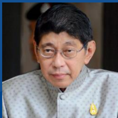
นายวิษณุ เครืองาม รองนายกรัฐมนตรี (ประธานกรรมการ)