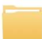
๒.ระดับพัฒนาคุณธรรม