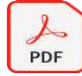
๓. กองบริหารทรัพยากรบุคคล

๓.๔ หน่วยงานในสังกัดกระทรวงสาธารณสุข และหน่วยงานระดับกองหรือเทียบเท่า จัดทำไฟล์แบบประเมินองค์กรคุณธรรมของหน่วยงานในสังกัดกระทรวงสาธารณสุข ประจำปีงบประมาณ พ.ศ. ๒๕๖๖ ให้แล้วเสร็จ และแปลงไฟล์ข้อมูลดังกล่าวให้อยู่ในรูปแบบไฟล์ PDF เพื่อรวบรวมข้อมูลในโฟลเดอร์ที่ปรากฏในข้อ ๓.๒ ทำการแปลงไฟล์ในข้อ ๓.๑ ให้เป็นไฟล์ข้อมูลอิเล็กทรอนิกส์ นามสกุลไฟล์ .zip และจัดส่งข้อมูลการประเมินฯ ให้กับศูนย์ปฏิบัติการต่อต้านการทุจริต กระทรวงสาธารณสุข