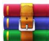
สำนักงานปลัดกระทรวงสาธารณสุข