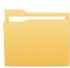
สำนักงานปลัดกระทรวงสาธารณสุข

๓.๑ สร้างโฟลเดอร์หลักเพื่อรวบรวมเอกสารทั้งหมดไว้ด้วยกัน และตั้งชื่อโฟลเดอร์ โดยระบุชื่อหน่วยงานให้ชัดเจน ตัวอย่าง เช่น