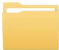
สำนักงานปลัดกระทรวงสาธารณสุข

๓.๔ หน่วยงานในสังกัดกระทรวงสาธารณสุข และหน่วยงานระดับกองหรือเทียบเท่า จัดทำไฟล์แบบประเมินองค์กรคุณธรรมของหน่วยงานในสังกัดกระทรวงสาธารณสุข ประจำปีงบประมาณ พ.ศ. ๒๕๖๖ ให้แล้วเสร็จ และแปลงไฟล์ข้อมูลดังกล่าวให้อยู่ในรูปแบบไฟล์ PDF เพื่อรวบรวมข้อมูลในโฟลเดอร์ที่ปรากฏในข้อ ๓.๒ ทำการแปลงไฟล์ในข้อ ๓.๑ ให้เป็นไฟล์ข้อมูลอิเล็กทรอนิกส์ นามสกุลไฟล์ .zip และจัดส่งข้อมูลการประเมินฯ ให้กับศูนย์ปฏิบัติการต่อต้านการทุจริต กระทรวงสาธารณสุข