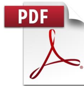
3. กองบริหารทรัพยากรบุคคล