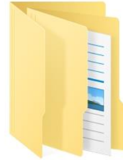
3. ระดับคุณธรรมต้นแบบ

๖.๕ ข้อมูลในโฟลเดอร์ “1. ระดับส่งเสริมคุณธรรม” โฟลเดอร์ “2. ระดับคุณธรรม” และโฟลเดอร์ “3. ระดับคุณธรรมต้นแบบ” ประกอบด้วยไฟล์ข้อมูลแบบประเมินของหน่วยงานระดับกองหรือเทียบเท่าในสังกัด พร้อมหลักฐาน ในรูปแบบไฟล์ PDF หน่วยงานละ ๑ ไฟล์ ตั้งชื่อไฟล์โดยมีเลขข้อเป็นลำดับหน่วยงานตามที่ระบุในไฟล์ “1. แบบสรุปผลการประเมิน.....(ชื่อหน่วยงาน).....” ซึ่งอยู่ในโฟลเดอร์ “1. สรุปผลการประเมินระดับหน่วยงาน” ตามด้วยชื่อหน่วยงานระดับกองหรือเทียบเท่า โดยในแต่ละไฟล์ให้จัดทำแบบประเมินองค์กรคุณธรรม และเอกสารหลักฐานประกอบการประเมิน ในรูปแบบไฟล์ PDF และรวมข้อมูลเข้าด้วยกันเป็น ๑ ไฟล์ตามวิธีการในข้อ ๖.๖