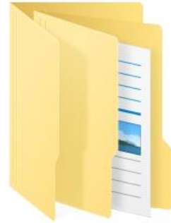
2. ระดับคุณธรรม