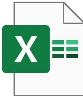
1. แบบสรุปผลการประเมิน สป.สร.

๒) ไฟล์ข้อมูล “2. แบบประเมินองค์กรคุณธรรม.....(ชื่อหน่วยงาน).....” ในรูปแบบไฟล์ PDF โดยจัดทำแบบประเมินองค์กรคุณธรรม และเอกสารหลักฐานประกอบการประเมินในรูปแบบไฟล์ PDF และรวมข้อมูลเข้าด้วยกันเป็น ๑ ไฟล์ ตามวิธีการที่ปรากฏในข้อ ๖.๖