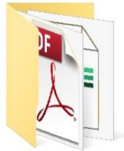
1. สรุปผลการประเมินระดับหน่วยงาน

๖.๒ จัดทำโฟลเดอร์ย่อยจำนวน ๒ โฟลเดอร์ย่อย ประกอบด้วย ๑) โฟลเดอร์ “1. สรุปผลการประเมินระดับหน่วยงาน” ๒) โฟลเดอร์ “2. ผลการดำเนินงานของหน่วยงานในสังกัด”