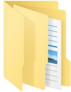
1. ระดับส่งเสริมคุณธรรม