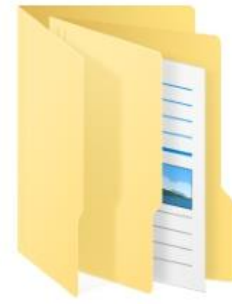
2. ผลการดำเนินงานของหน่วยงานในสังกัด

๖.๓ ข้อมูลในโฟลเดอร์ “1. สรุปผลการประเมินระดับหน่วยงาน” ประกอบด้วย