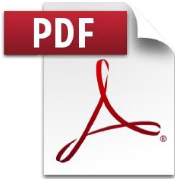
๑. กองบริหารการคลัง

๖.๓ ข้อมูลในโฟลเดอร์ “1. ระดับส่งเสริมคุณธรรม” โฟลเดอร์ “2. ระดับคุณธรรม” และโฟลเดอร์ “3. ระดับคุณธรรมต้นแบบ” ประกอบด้วยไฟล์ข้อมูล แบบประเมินของหน่วยงานระดับกองหรือเทียบเท่าในสังกัด พร้อมหลักฐาน ในรูปแบบไฟล์ PDF หน่วยงานละ ๑ ไฟล์ ตั้งชื่อไฟล์โดยมีเลขชื่อเป็นลำดับหน่วยงานตามที่ระบุในไฟล์ “1. แบบสรุปผลการประเมิน...(ชื่อหน่วยงาน).....” ซึ่งอยู่ในโฟลเดอร์ “1. สรุปผลการประเมินระดับหน่วยงาน” ตามด้วยชื่อหน่วยงานระดับกองหรือเทียบเท่า โดยในแต่ละไฟล์ให้จัดทำแบบประเมินองค์กรคุณธรรม และเอกสารหลักฐานประกอบการประเมิน ในรูปแบบไฟล์ PDF และรวมข้อมูลเข้าด้วยกันเป็น ๑ ไฟล์ ตามวิธีการในข้อ ๖.๔