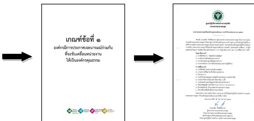
(๔) หน้าคั่นแสดง “หัวข้อเกณฑ์การประเมิน”