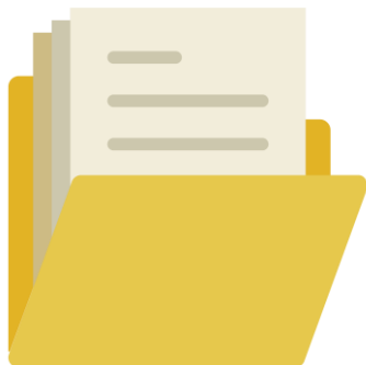
๒. ระดับคุณธรรม