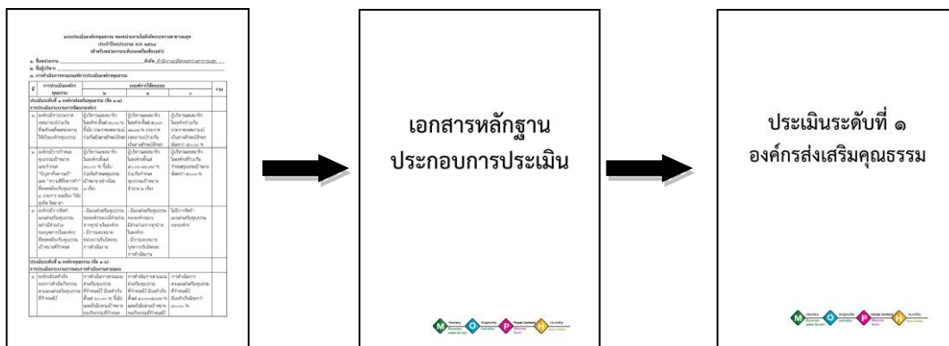
(๑) แบบประเมินองค์กรคุณธรรมของหน่วยงาน (๒) หน้าคั่น “เอกสารหลักฐานประกอบการประเมิน” (๓) หน้าคั่นแสดง “ระดับการประเมิน”