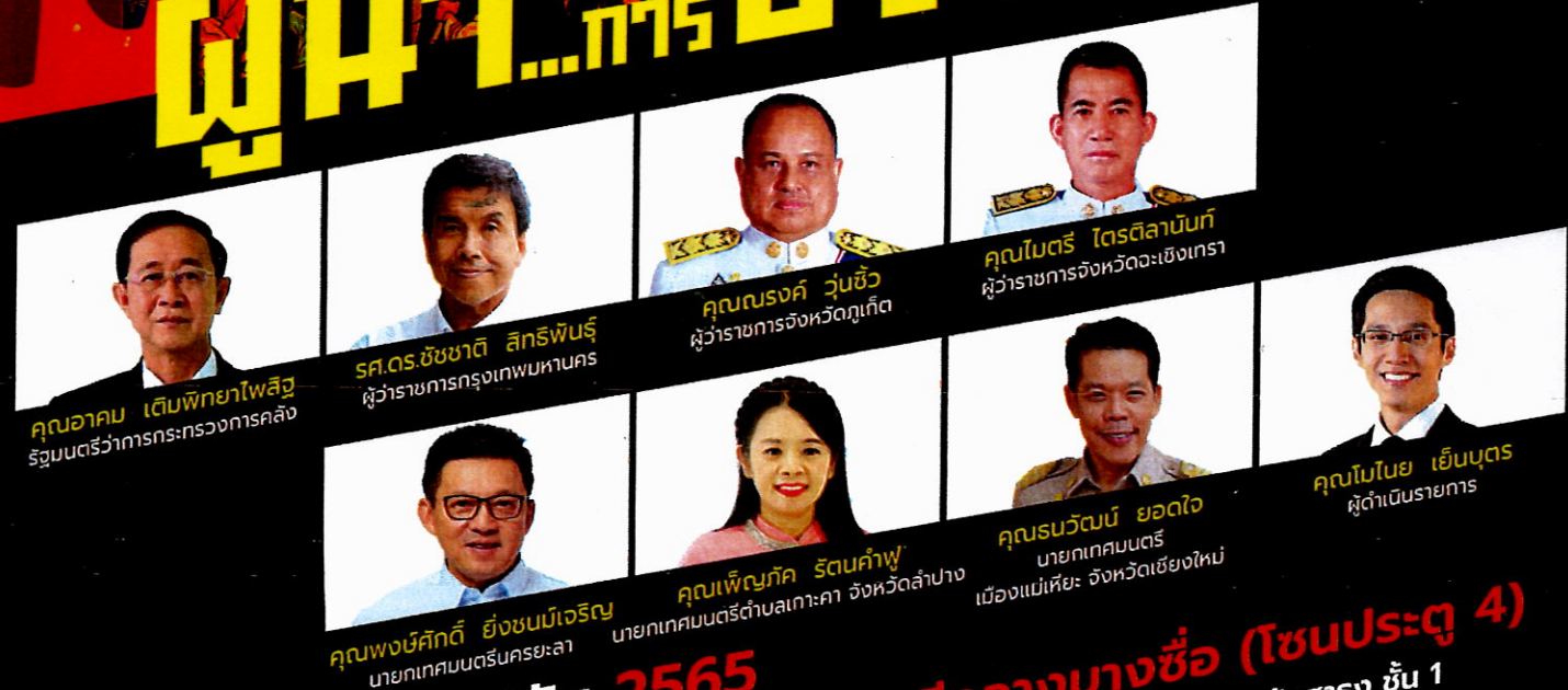
คุณอาคม เต็มพิทยาไพสิฐ รัฐมนตรีว่าการกระทรวงการคลัง