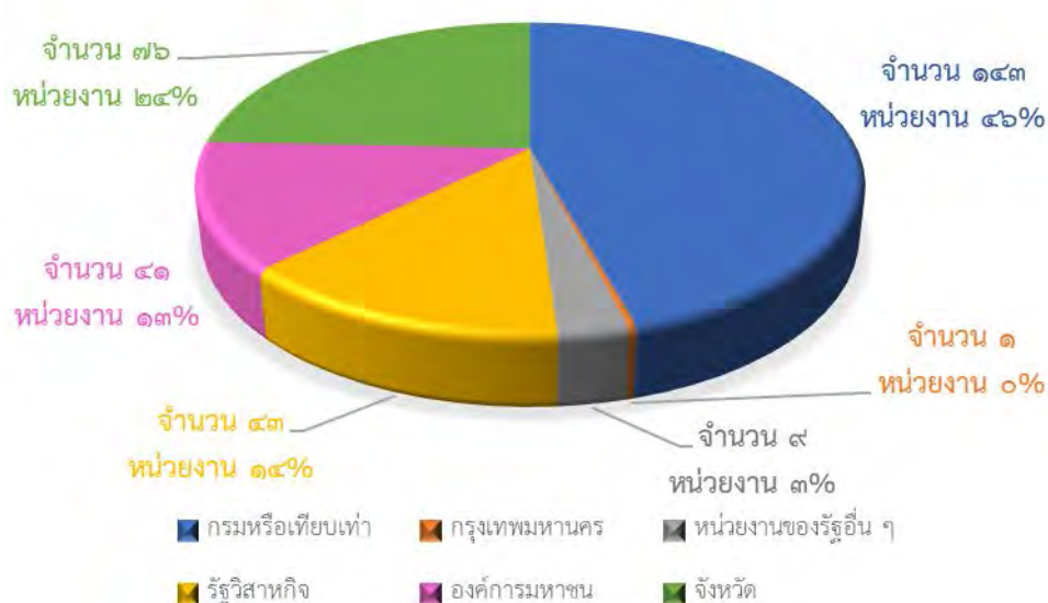
แผนภูมิที่ ๑.๑ จำแนกตามหน่วยงาน