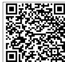
เอกสารประกอบการประชุม