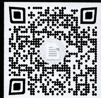
แบบสอบถาม การเข้าใช้งานระบบ