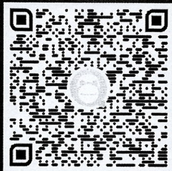
คู่มือการใช้งานระบบ Platform