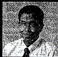
นายชัชชาติ สิกิริพันธ์ ผู้ว่าราชการ กรุงเทพมหานคร