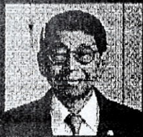
นายวินชุน เครื่องงาม รองนายกรัฐมนตรี