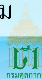
ประกาศคุณธรรมอัตลักษณ์