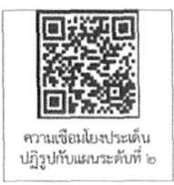
ความเชื่อมโยงประเด็นปฏิรูปกับแผนระดับที่ ๒

ประเทศสิ้นสุดลงเมื่อวันที่ ๓๑ ธันวาคม ๒๕๖๕ โดยได้ดำเนินการปฏิรูปประเทศให้บรรลุผลสัมฤทธิ์ตามเป้าหมายของรัฐธรรมนูญ ที่กำหนดแล้ว อย่างไรก็ตาม เพื่อให้เกิดความยั่งยืนของผลสัมฤทธิ์ตามเจตนารมณ์ของรัฐธรรมนูญฯ ทั้งหน่วยงานรับผิดชอบหลักและหน่วยงานร่วมดำเนินการ จำเป็นต้องนำประเด็นปฏิรูปประเทศมาดำเนินการต่อเนื่องต่อไป ผ่านกลไกของแผนระดับที่ ๒ แผนระดับที่ ๓ และการดำเนินการต่าง ๆ ของหน่วยงาน ตามแนวทางการดำเนินการภายหลังการสิ้นสุดของแผนปฏิรูปประเทศ ที่คณะรัฐมนตรีเมื่อวันที่ ๒๗ กันยายน ๒๕๖๕ มีมติรับทราบผลการประชุมของคณะกรรมการยุทธศาสตร์ชาติในคราวประชุมครั้งที่ ๒/๒๕๖๕ โดยสำนักงานฯ ได้เชื่อมโยงประเด็นปฏิรูปประเทศกับเป้าหมายแผนแม่บทย่อย (Y1) ของแผนแม่บทภายใต้ยุทธศาสตร์ชาติ และเป้าหมายระดับมหุตหมายของแผนพัฒนาเศรษฐกิจและสังคมแห่งชาติ ฉบับที่ ๑๓ เพื่อใช้เป็นกรอบในการดำเนินการขับเคลื่อน ติดตาม ประเมินผลการดำเนินการในประเด็นการปฏิรูปด้านต่าง ๆ ที่มีความเกี่ยวเนื่องกัน เพื่อให้เกิดการดำเนินการที่ต่อเนื่องและเกิดผลสัมฤทธิ์ที่ยั่งยืน ส่งผลให้การพัฒนาประเทศบรรลุเป้าหมายของยุทธศาสตร์ชาติในที่สุด