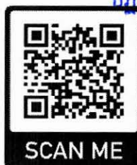
ลงทะเบียนรับชมออนไลน์