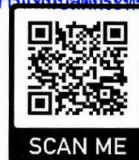
แบบตอบรับจัดนิทรรศการ