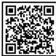
ส่งจองเสื่อสัญลักษณ์

“ชื่อสัตย์ เป็นธรรม มีอาชีพ โปร่งใส ตรวจสอบได้”