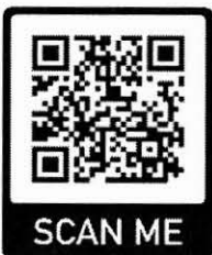
ลงทะเบียนผู้เข้าร่วมงาน