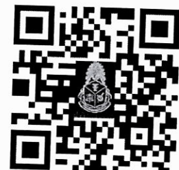
รวมตำแหน่งที่มีหน้าที่ยื่นบัญชี