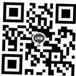
Line Group : ACAS-ODRS

หมายเหตุ ** ในการบันทึกข้อมูลผู้มีหน้าที่ยื่นบัญชีทรัพย์สินและหนี้สิน ให้เจ้าหน้าที่ที่ได้รับมอบหมายบันทึกข้อมูล สแกนไฟล์คำสั่งแต่งตั้งหรือหนังสือแสดงวันที่เข้ารับตำแหน่งหรือพ้นจากตำแหน่ง แนบมาในระบบ ODRS ทุกครั้ง **