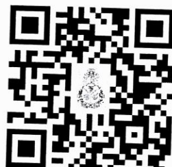
คู่มือการใช้ระบบ ODRS